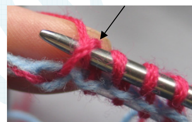
Abstricken des linken Maschenbogens